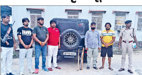
खरखोदा। पुलिस की गिरफ्त में युवक।