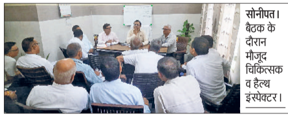
सोनीपत। बैठक के दौरान मौजूद चिकित्सक व हेल्थ इंस्पेक्टर।

जिले में डेंगू और मलेरिया के बढ़ते मामलों को देखते हुए स्वास्थ्य विभाग सतर्क हो गया है। सोमवार को डिप्टी सिविल सर्जन डा. जितेंद्र ने जिले के सभी हेल्थ इंस्पेक्टरों के साथ बैठक कर अभियान की समीक्षा की और फील्ड में लारवा नष्ट करने की गतिविधियां तेज करने के निर्देश दिए। उन्होंने कहा कि बुधवार के हर मरीज की ब्लड स्लाइड अनिवार्य रूप से बनाई जाए और तुरंत लैब में भेजी जाए ताकि संक्रमण की त्वरित पुष्टि हो सके। डॉ. जितेंद्र ने बताया कि इस सीजन में अब तक डेंगू के 11 और मलेरिया के 8 मामले सामने आ चुके हैं। विभाग ने अब तक