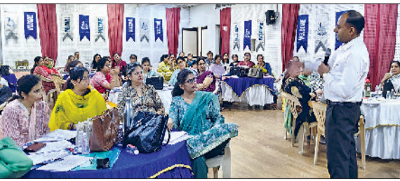
सोनीपत। कार्यशाला में उपस्थित शिक्षकों को जानकारी देते वक्ता।