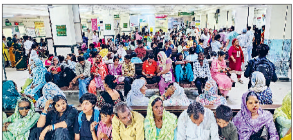
सोनीपत। ओपीडी में इंतजार करते मरीज।