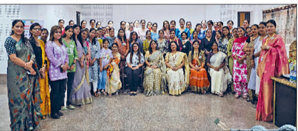
सोनीपत। जैन विद्या मंदिर में आयोजित कार्यक्रम में प्रतिभागी शिक्षक।