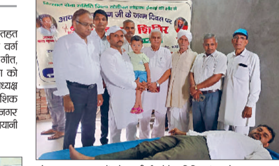
गोहाना। रक्तदाताओं को आशीर्वाद देते अतिथि एवं आयोजक।