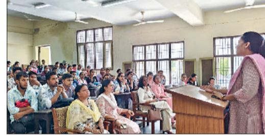
खरखौदा। विद्यार्थियों का मार्गदर्शन करते शिक्षक।